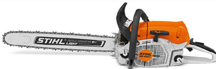
Bild: Motorsäge STIHL MS 462