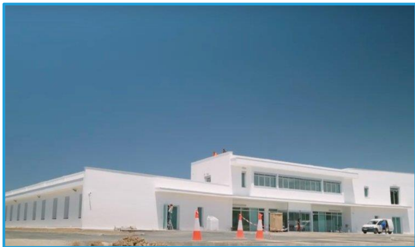
Κλινικές Οξέων περιστατικών Γυναικών και Ανδρών, ΔΥΨΥ