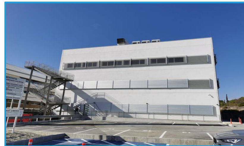
Νέα Μονάδα Αιμοκάθαρσης, Γ.Ν. Πάφου