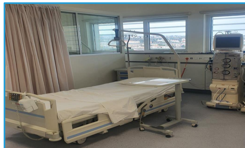
Νέα Μονάδα Αιμοκάθαρσης, Γ.Ν. Πάφου