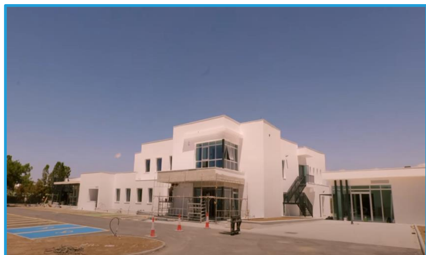
Θεραπευτική Μονάδα Εξαρτημένων Ατόμων (ΘΕΜΕΑ), ΔΥΨΥ